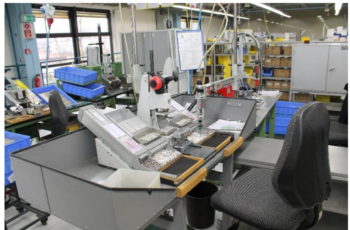
Moderne One-Piece-Workflow-Arbeitsplätze erzielen Wirkungen in mehreren Handlungsfeldern – hier profitieren die Mitarbeiter und das Unternehmen gemeinsam.